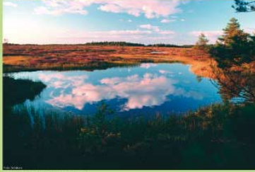
Moorfeld in einem unbesiedelten Hochmoor